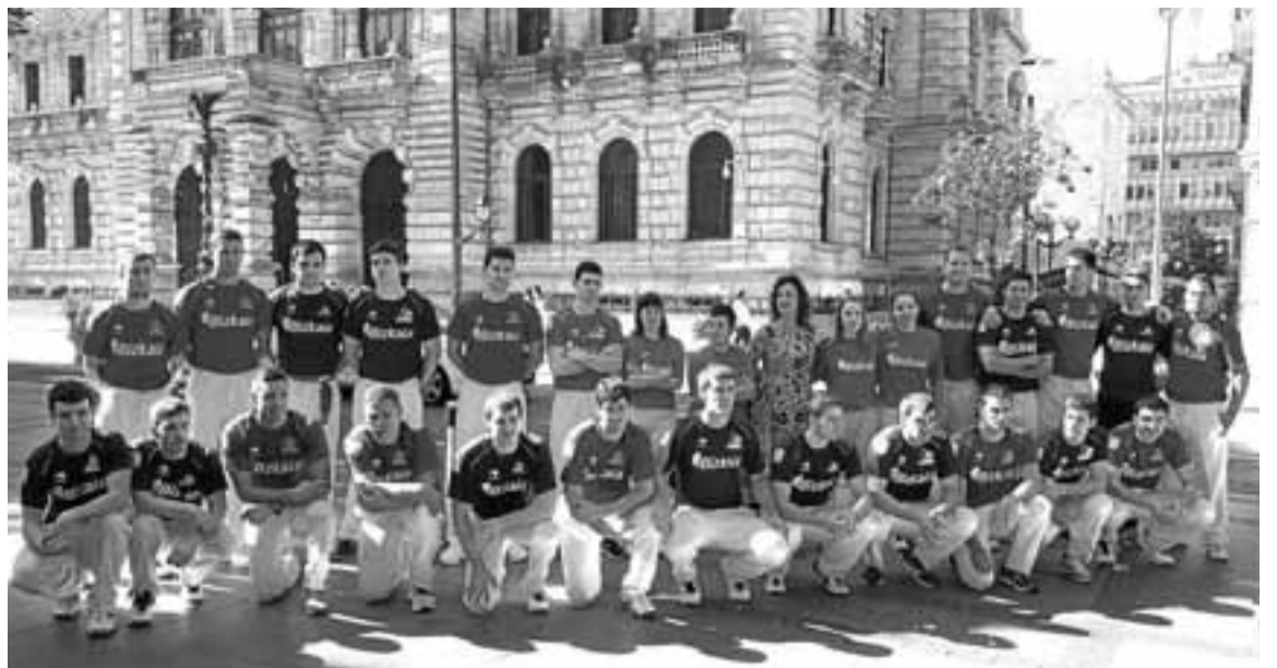
Pelotaris participantes ayer en el centro de la capital vizcaína.

En realidad, él ya lo sabe. La primera noche en Annapolis, después de finalizar, nos costó ver a gente en la calle. Seguía existiendo el mundo. En once días prácticamente sólo hemos tenido contacto con nuestras caras, nuestras voces, nuestras personalidades. Agobiaba reencontrarse con una realidad al margen de la Race Across America. Pero algo tendremos que hacer para salir del bucle de personas y de esta locura. Por ejemplo, tocar la guitarra.